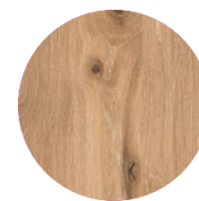
Chêne sauvage blanc

qu'eut lieu le premier entretien entre les dirigeants au cours duquel ils se sont découverts de nombreux points communs. Parmi ces points communs, le penchant pour le perfectionnisme. Ou bien l'amour du design, un design à même de toucher les sens. Ou encore l'esprit d'innovation sans compromis. Parce que la frontière entre la salle de bains et la salle de séjour s'estompe inéluctablement, les entrepreneurs décidèrent d'unir les compétences des deux sociétés dans l'optique d'un projet tout particulier. Le résultat, c'est EDITION LIGNATUR.